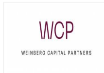
Weinberg Capital Partner...